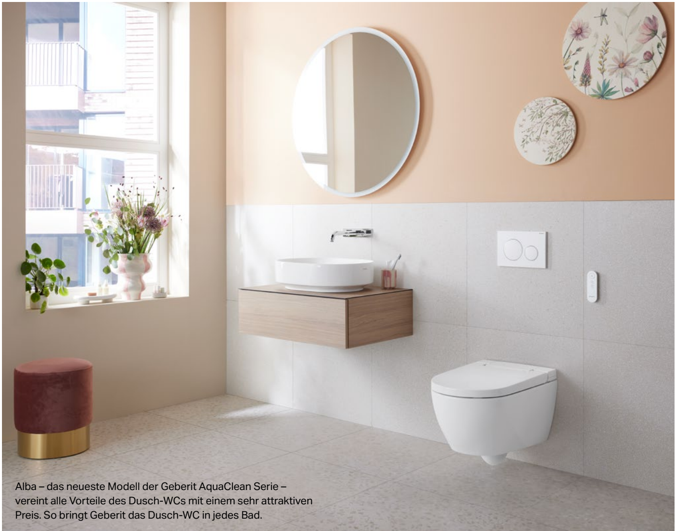
Alba – das neueste Modell der Geberit AquaClean Serie – vereint alle Vorteile des Dusch-WCs mit einem sehr attraktiven Preis. So bringt Geberit das Dusch-WC in jedes Bad.

Hygiene spielt eine essentielle Rolle für unser Wohlbefinden. Dabei wird das WC oftmals unterschätzt – denn wie in Bad und Dusche gilt auch hier: nur die Reinigung mit Wasser verleiht uns ein wirklich sauberes und angenehm frisches Gefühl. Hier kommt das Dusch-WC ins Spiel. Es reinigt den Po nach dem Toilettengang sanft mit einem warmen Wasserstrahl. Der Sanitätspezialist Geberit bietet mit der AquaClean Serie für jedes Badezimmer das richtige Modell.